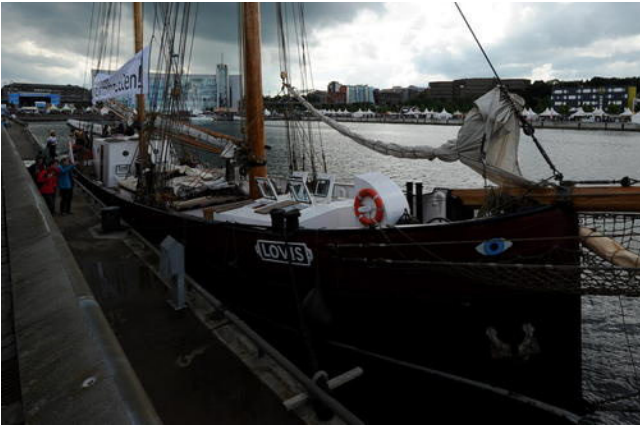
Ob die „Lovis“ historisch ist, wird mittlerweile angezweifelt.

Was ist historisch? Für Traditionsschiffe ist die Antwort darauf eine Frage der Existenz. Die Betreiber beklagen, dass die Anforderungen zu streng geworden sind. Vielen alten Seglern droht das Aus - so wie dem Bildungsschiff „Lovis“, das zur Kieler Woche in der Landeshauptstadt angelegt hat.